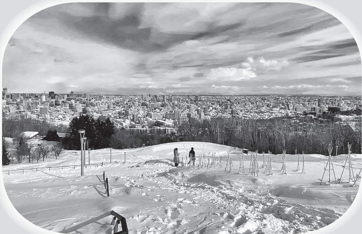
新雪を踏み分け、新春の市街を一望（札幌・旭山記念公園、昨年1月）